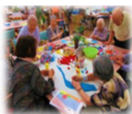
手芸・工作クラブ