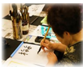
書道・絵手紙クラブ